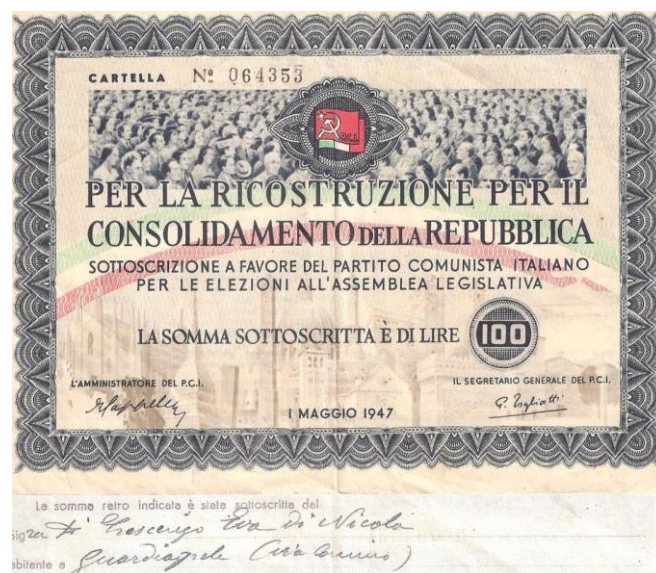
Versamento di 100 lire per la Ricostruzione ed il Consolidamento della Repubblica nel 1947.

La collaborazione e l'attivismo non si fermarono a Comino ma si estesero a tutta Guardiagrele, dove organizzò con successo innumerevoli battaglie per la difesa dei diritti dei cittadini.