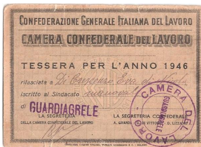
Tessera di adesione alla CGL del 1946.

E in Eva si rafforzavano lo spiccato senso civico e il forte sentimento di solidarietà: era sempre pronta ad alleviare le pene dei sofferenti ed era sempre tra la gente a dare speranza e a diffondere l'idea che un mondo migliore era possibile, come era possibile una più equa distribuzione del benessere e delle opportunità.